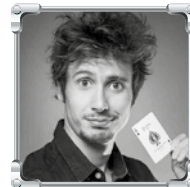
Butzi Magician & Inspirational speaker: The magic of creativity

WORKSHOP Pre-conference workshop με την Audrey Tang τη Δευτέρα 21 Μαΐου, OTEAcademy, Αίθουσα ΣΟ10