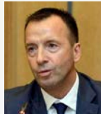
Κωνσταντίνος Αγραπιάδης Διεύθυνση Αμοιβής της Εργασίας, Υπουργείο Εργασίας Διδάκτωρ Παντείου Πανεπιστημίου