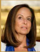
Άννα Διαμαντοπούλου Πρόεδρος του Δικτύου για τη Μεταρρύθμιση στην Ελλάδα και την Ευρώπη, πρώην Υπουργός Παιδείας και Θρησκευμάτων