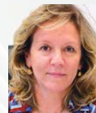
Έφη Μπσόδρα πρ. Πρόεδρος ΙΚΥ - Ίδρυμα Κρατικών Υποτροφιών, Καθηγήτρια Ιατρικής Σχολής Πανεπιστημίου Αθηνών