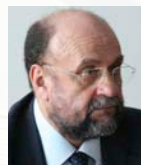
Βασίλης Κουλιαδής Ομότιμος Καθηγητής, πρ. Γεν. Γραμματέας Υπουργείου Παιδείας