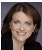
Βάσω Κόλλια Πολιτικός Επιστήμων, πρ. Γεν. Γραμματέας Ισότητας των Φύλων