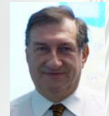
Σωκράτης Κάτσικας Πρύτανης Ανοικτού Πανεπιστημίου Κύπρου, Καθηγητής, τμήμα Ψηφιακών Συστημάτων, Πανεπιστήμιο Πειραιά