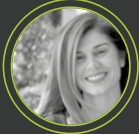
Ντόρα Οικονόμου Όμιλος ΟΠΑΠ