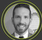
Δημήτρης Σταυρούλιας Public