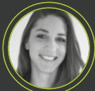
Μαρία Βαθυλάκη Parfums Christian Dior

Πρακτικές, στρατηγικές και εμπειρίες στο ετήσιο πολυαναμενόμενο sequel!