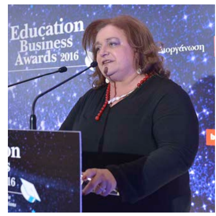
Η πρόεδρος της κριτικής επιτροπής Μ. Γιαννάκου, πρώην Υπουργός

Την Τελετή Απονομής, την οποία παρουσίασε η δημοσιογράφος Μαρία Αναγνωστοπούλου , άνοιξε η πρόεδρος της κριτικής επιτροπής, Μαριέττα Γιαννάκου , η οποία καλωσόρισε τους παρευρισκόμενους, αναφερόμενη στην αξία των βραβείων για τον κλάδο και συγχαίροντας τους οργανισμούς που ξεχώρισαν. Μεταξύ άλλων έκανε λόγο για μια ευκαιρία ώστε να αναδειχθούν στον χώρο της Εκπαίδευσης καινοτόμες πρωτοβουλίες, καλές πρακτικές, δεξιότητες και ό,τι συνιστά την Παιδεία και την Εκπαίδευση σήμερα.