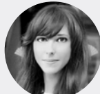
Fiorenza Plinio Global Head of Creative Excellence, Cannes Lions International Festival of Creativity