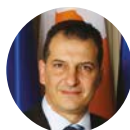
Γιώργος Λακκοτρύπης Υπουργός Ενέργειας, Εμπορίου, Βιομηχανίας και Τουρισμού Κυπριακή Δημοκρατία

ΞΕΧΩΡΙΣΤΟΙ ΟΜΙΛΗΤΕΣ ΑΠΟΚΑΛΥΠΤΟΥΝ ΠΩΣ Η ΕΛΛΑΔΑ ΜΠΟΡΕΙ ΝΑ ΑΝΑΔΥΘΕΙ ΟΣ BUSINESS HUB