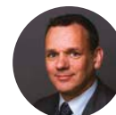
Caspar Veldkamp Ambassador of Netherlands The Embassy of Netherlands in Athens