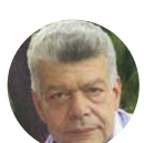
Καθηγητής Ιωάννης Θ. Μάζης Καθηγητής Οικονομικής Γεωγραφίας & Γεωπολιτικής Πανεπιστήμιο Αθηνών