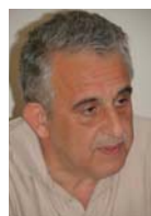
Αντώνης Παπαδερράκης, Γενικός Γραμματέας Εμπορίου & Καταναλωτή, Υπουργείο Οικονομίας, Υποδομών, Ναυτιλίας & Τουρισμού