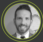
Δημήτρης Σταυρούπολος Public