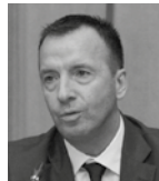
Κωνσταντίνος Αγραπιδάς Υπουργείο Εργασίας, Κοινωνικής Ασφάλισης και Κοινωνικής Αλληλεγγύης