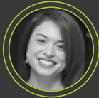
Αιμιλία Στέλιου Όμιλος ΟΠΑΠ