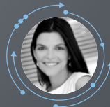
Χριστίνα Βασιλικού Κέντρο Πολιτισμού Ίδρυμα Σταύρος Νιάρχος