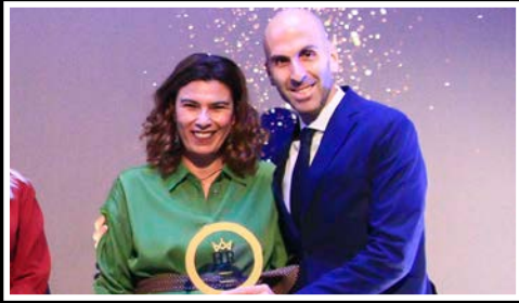
Global Shapers Athens Hub