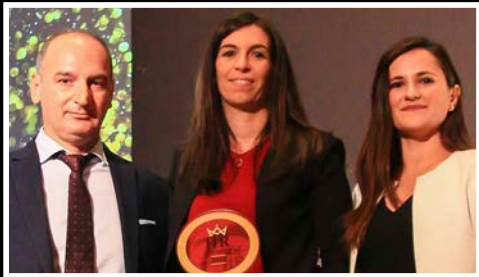
Coca Cola Τρία Έπιθον