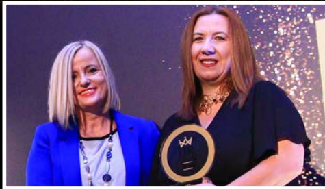
DHL Express Hellas