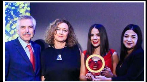
FOURLIS Group of Companies