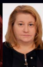
Ανατολή Κοζάρη Εθνικό Κέντρο Δημόσιας Διοίκησης & Αυτοδιοίκησης (ΝΕ/ΕΚΔΑΑ)