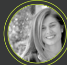
Ντόρα Οικονόμου Όμιλος ΟΠΑΠ