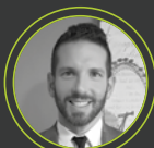
Δημήτρης Σταυρόπουλος Public