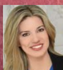
Τίνα Τορίμπαμπα Hilton Athens