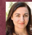
Κατερίνα Στεμπίλη Μονοπάτια Πολιτισμού