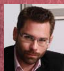
Λεωνίδας Μπέης Kassandra Bay Resort & Spa