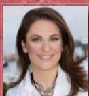
Βαρβάρα Ανδή Ελληνικά Ιστορικά Ξενοδοχεία