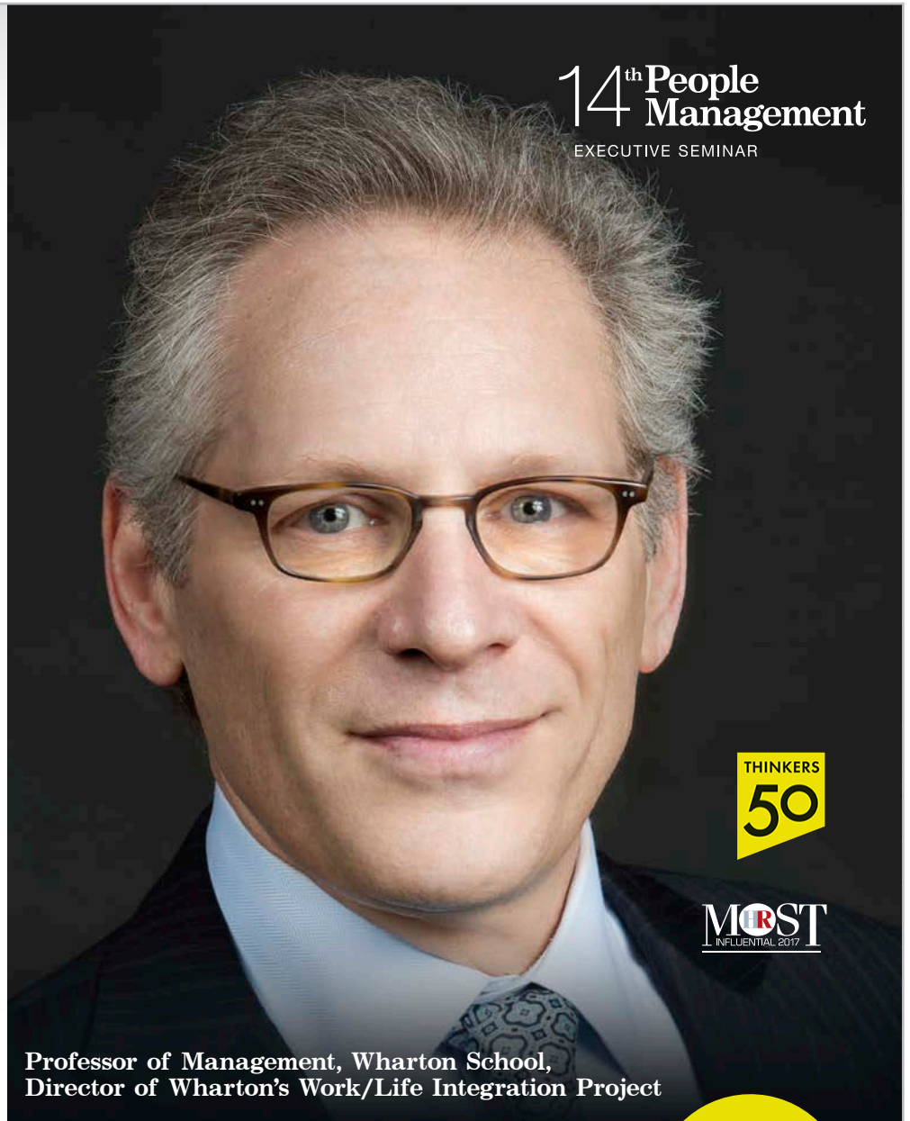
Professor of Management, Wharton School, Director of Wharton's Work/Life Integration Project