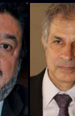
Αντώνης Χριστοδούλου Δ/νση Ασφάλειας και Υγείας στην Εργασία, Υπουργείο Εργασίας

Τελική Ημερομηνία Υποβολής των Υποψηφιοτήτων έως τις 22 Ιουλίου 2015