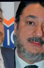
Δρ. Πάνος Χατζηπόλος Πρόεδρος, Project Management Institute (PMI)